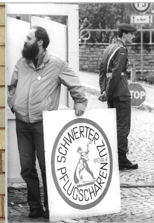
30. Oktober 1989